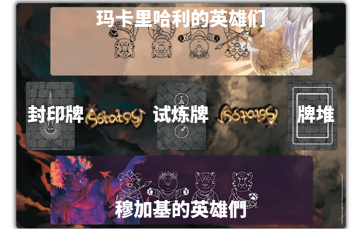
玛卡里哈利的英雄们

在翻转伊利亚特起始包中,包含一张游戏垫。并非一定要有游戏垫才能玩,但它仍然很有帮助。